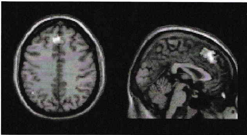
Fig. I.3. Activarea cortexului medial prefrontal constatată în situații de competiție. Clusterele sunt suprapuse pe secțiuni RMN orizontale ( z = 40 ) și sagital ( y = -2 ) (Decety și alții, 2004, p. 749)

Res din cadrul fiecărei ore, activitatea didactică se desfășura folosindu-se ca strategie învățarea prin cooperare. Fiecare elev prelua pentru o anumită perioadă conducerea grupe și primea responsabilitățile corespunzătoare rolului său. Ca rezultat al experimentului, s-au constatat modificări în comportamentul elevilor, dar și ale randamentului clasei ca întreg. Astfel, relațiile dintre elevi s-au înmulțit, bucuria de a învăța și randamentul școlar au crescut. Eficiența relațiilor sociale a fost mai mare, fapt evidențiat de promptitudinea copiilor de a asculta indicațiile șefului de grupă, transformarea ajutorului reciproc într-un comportament frecvent. Volumul relațiilor sociale s-a extins prin interacțiunea și cu alți membri ai clasei, constatându-se o extindere a acestora și în cadrul activităților extrașcolare (Ecke, 1987, pp. 96-97).